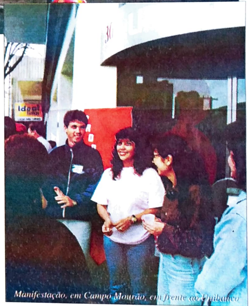
Manifestação, em Campo Mourão, em frente ao Unibanco

Para ele, além da cobrança dos associados sobre a atual diretoria, seria interessante participar das assembleias e na próxima eleição para renovação da diretoria, analisar melhor as propostas das chapas concorrentes.