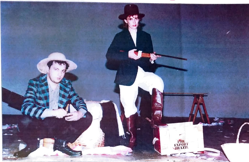
Bia e Gil numa cena da peça "Ave Arribação"

O trabalho bancário é uma das atividades profissionais mais estressantes, sobretudo para os funcionários que executam atendimento direto a clientes e usuários dos bancos, principalmente aqueles que exercem o cargo de caixa.