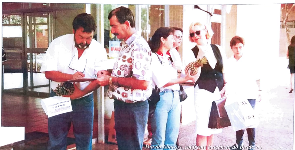
Dia do Abacaxi, em frente à agência do Bradesco

A Fenaban, mesmo admitindo que as reivindicações dos bancários são justas (e continuam sendo), instruíram os seus