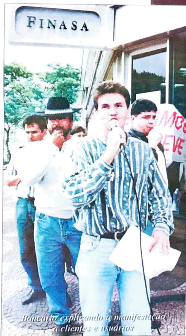
Bancário explicando a manifestação a clientes e usuários

Para isso é necessário mais engajamento dos bancários que trab-