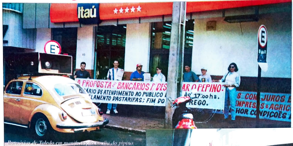
Bancários de Toledo em manifestação no dia do pepino.

Enquanto os bancários da CUT, que representa mais de 90% da categoria (como os bancários de São Paulo, Rio de Janeiro, Porto Alegre, Curitiba, Londrina, Florianópolis e Belo Horizonte), faziam manifestações, paralizações e greve, combinando com os inúmeros e insistentes pedidos de negociações, a Contec e seus sindicatos (como Cascavel, Goio-Erê, entre outros), não moveram uma "palha" em prol de melhores salários, garantia de emprego e condições de vida dos associados.