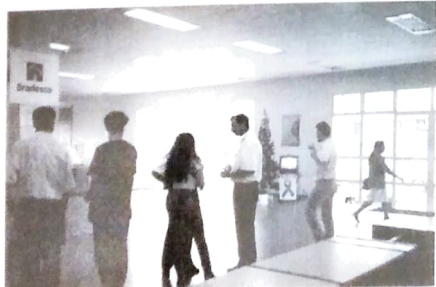
Bradesco: 146 milhões a menos