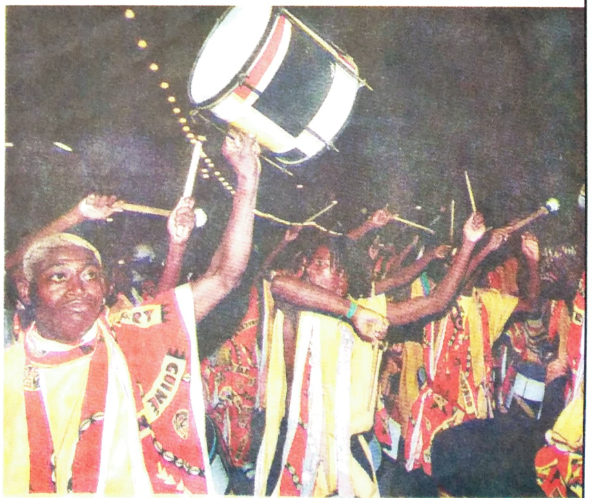
Carnaval: festa mostrada na imprensa exclui os brasileiros sem dinheiro

Esses números você não vê na grande imprensa porque não interessa a quem manda vê-los publicados.