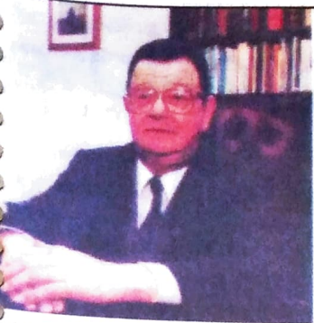
favor de R$ 65 milhões ido pela imprensa

om R$ 102 milhões em apenas 6 dias; o valor representa 48% o total dos recursos que estavam disponíveis. O PMDB li- berou R$ 97 milhões de suas emendas ao longo de 97, e R$ 28 milhões em 26 dias, exata- mente 42% do valor disponível. Além das emendas parlamen- tares, uma expressiva soma de convênios com prefeituras e es- tados foi liberada na semana de o dia da votação da reforma da Previdência na Câmara. Os con- vênios, quase todos assinados com a Caixa Econômica Fede- ral e Secretaria de Recursos Hídricos, somam mais de R$ 40 milhões. Com isso, prefeitos e go- vernadores pressionam deputa- dos para votarem a favor dos pro- jetos de FHC.