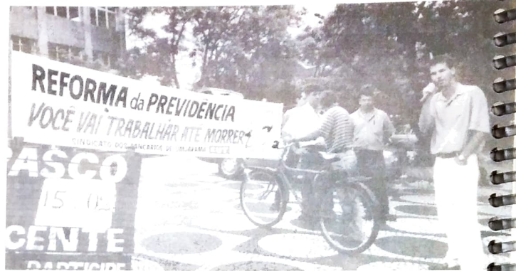
Manifestação contra a reforma da previdência em Umuarama

são popular. Abaixo, a relação daqueles que votaram contra e a favor do trabalhador.