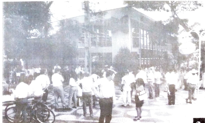
Manifestações contra o desemprego podem voltar no HSBC

A Comissão de Empresa dos funcionários do HSBC, através do Dieese, estuda o balanço do Banco, e intensificam a cobrança pelo pagamento da PLR. Planejam também mobilizações que podem chegar a operação tartaruga e paralisações caso o Banco não pague o PLR e cumpra a ameaça de demitir funcionários.