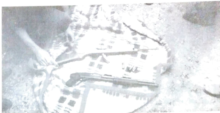
Armas utilizadas pelos fazendeiros para atacar os sem-terras

Camargo Filho, ocorrida no dia 07 de fevereiro deste ano, na fazenda Água da Prata, de 850 Alqueires, no município de Marilena, próximo a Paranaíba-PR. Fazendeiros armaram e treinaram jacunços assassinar os trabalhadores que lutavam pela vida, pelo trabalho, por comida.