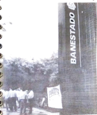
Protesto no Banestado por aumento salarial

O Comando Nacional dos Funcionários do Banestado, composto pela FETEC e Sindicatos, conseguiu do secretário estadual de finanças do Paraná, Giovanni Gionédís, a promessa de pagamento de 5% de reajuste salarial, índice igual ao que a Fenaban negociou para seus filiados. O Banestado relutava em pagar, mas é filiado à Fenaban e deve cumprir o acordo.