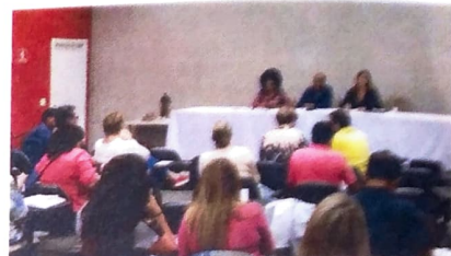
Reunião da COE Itaú preparatória e reunião com o banco.