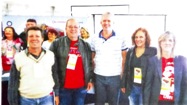
Delegados e delegadas do Pactu no 34º Conecef

Após dois dias de intensos debates, reunindo 312 delegados de todo o país, representando empregados da ativa e aposentados, o 34º Congresso Nacional dos Empregados da Caixa Econômica Federal