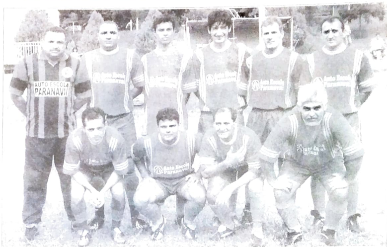
Bradesco/Auto Escola Paranavaí é campeã