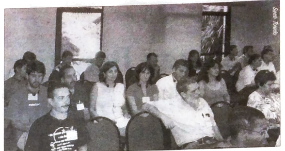
A realidade brasileira no campo do trabalho foi debatida durante o evento

Nos dias 4, 5 e 6 de abril foi realizado em Florianópolis (SC) o Seminário Internacional "Acidente de Trabalho - Mudanças de indicadores e garantias sociais/ Desafios da ação sindical". Além de vários aspectos relacionados à saúde do trabalhador, o evento debateu temas como a execução das políticas sociais, emprego e renda no Brasil, acidentes e doenças do trabalho e o mercado de trabalho na Europa e a legislação europeia de saúde e segurança no trabalho, a previdência e as políticas de proteção social na Itália e a realidade da América Latina em torno do emprego, trabalho e legislação de saúde e seguran-