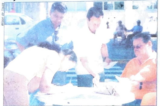
No Pactu, os Sindicatos promovem a coleta de assinaturas para Emenda Constitucional pela redução da jornada sem redução dos salários

Trabalhadores de todo o país estão sendo engajados na campanha pela redução da jornada de trabalho, de 44 para 40 horas semanais. É uma proposta da CUT e de várias outras centrais sindicais, que vêem a possibilidade de gerar 2,8 milhões de novos postos de trabalho e, assim, contribuir para a redução do desemprego. No Paraná, a campanha foi lançada no início de abril, em Curitiba, com participação dos Sindicatos do Pactu. Um dos instrumentos dessa luta é um abaixo assinado em que a palavra de ordem é "Reduzir a Jornada é Gerar Empregos". O objetivo das centrais sindicais é defender a tramitação, em caráter emergencial, da Proposta de Emenda Constitucional 393/01, de autoria do senador Paulo Paim (PT-RS) e do deputado federal Inácio Arruda (PcdoB-CE), que prevê a redução da jornada de trabalho sem redução do salário.