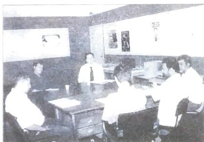
Os Sindicatos do Pactu cobram de representantes do Itaú, soluções de problemas como a falta de funcionários e outros

No dia 27 de abril, em Curitiba, os sindicatos de bancários do Paraná terão reunião com representantes do Itaú. Na ocasião, deverão debater uma série de assuntos de interesse dos bancários do Itaú, principalmente as suas reclamações e reivindicações para melhorias no plano de saúde, no plano odontológico e nas condições de trabalho nas agências do Itaú e Banestado. No Banestado, os empregados reclamam do mobiliário (que ainda são aqueles causadores de LER), de equipamentos antigos, principalmente os caixas eletrônicos e de poucos funcionários para executar o trabalho. Mas a principal reclamação no Itaú/Banestado é a falta de funcionários para atender principalmente nas agências que viraram bandeiras recentemente.