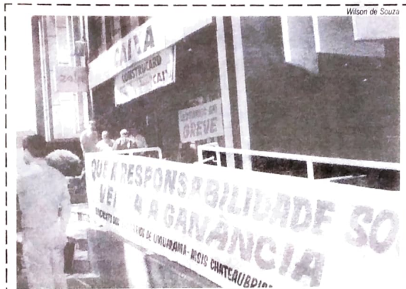
Caixa teve lucro alto e pode atender reivindicação dos empregados

O corte de despesas e eliminação de desperdícios rendeu R$80,2 milhões à CEF, que fechou o primeiro trimestre de 2004 com lucro líquido de R$ 404 milhões. Isto corresponde a um crescimento de 17,61% em relação ao mesmo período de 2003, quando o lucro foi de R$ 344 milhões. Só no ano passado a Caixa economizou R$ 284 milhões. O resultado do lucro da CEF revelou que a empresa vem priorizando o lucro, antes de tudo. A categoria bancária, que tem lutado por melhores salários e condições de trabalho, observou nos últimos dias o expressivo crescimento dos lucros dos bancos. O resultado da CEF, bem como do Unibanco, Itaú e Bradesco, é um forte estímulo para a categoria bancária se engajar na Campanha Salari-