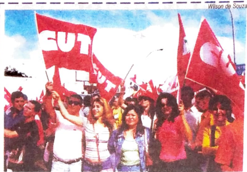
O Pactu participou das manifestações em Foz do Iguaçu

Redução da jornada de trabalho de 44 para 40 horas semanais, sem redução de salário, geração de empregos e uma política de recuperação do valor real do salário mínimo. Essas foram as principais bandeiras do 1º de maio, com manifestações organizadas pela CUT e seus sindicatos, em todo o país. No Paraná, a maior concentração aconteceu em Foz do Iguaçu. O Pactu esteve representado por vários trabalhadores que saíram em carnavas de Umuarama, Campo Mourão e Toledo. Em paranavai, o Seeb também promoveu atividades para comemorar o 1º de Maio. Além de um Ato Ecumênico, houve brincadeiras e distribuição de doces e pipoca para a criançada. Já em Guarapuava, o Seeb promoveu distribuição de material alusivo ao Dia do Trabalhador e programou para o dia 29 de maio um torneio de futebol suíço e um almoço de confraternização para bancários e familiares.