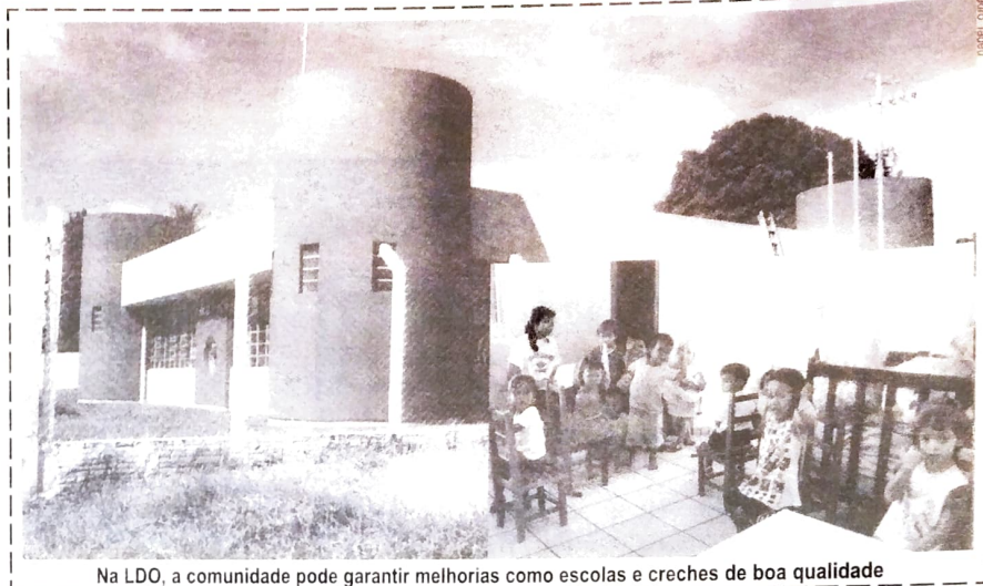
Na LDO, a comunidade pode garantir melhorias como escolas e creches de boa qualidade