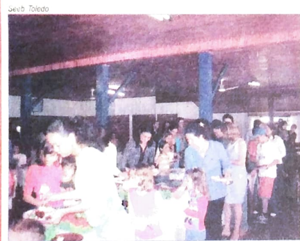
Almoço com bancários e familiares, em Toledo