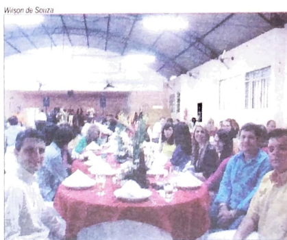
Jantar dos Bancários em Umuarama