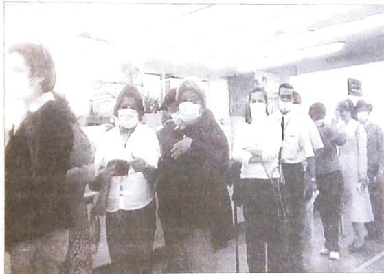
Seeb Campo Mourão

Neste banco tudo é grande. Os lucros são enormes. Grandes também são as tarifas cobradas de quem precisa manter uma conta ou tomar dinheiro emprestado. Maior ainda é o descaso com que este banco trata seus empregados. Na agência de Campo Mourão, e em outras da região, um problema vem deixando os bancários doentes. São os carpetes úmidos e fedidos. Com o mau cheiro até se adapta. O problema é o grande número de bancários com doenças respiratórias. Para resolver o problema, o Sindicato dos Bancários de Campo Mourão realizou uma manifestação pedindo providências. Essa manifestação teve apoio de clientes e usuários do Itaú, que também usaram máscaras em protesto contra o problema no banco. Logo após essas manifestações, o banco providenciou a troca do carpete em Campo Mourão.