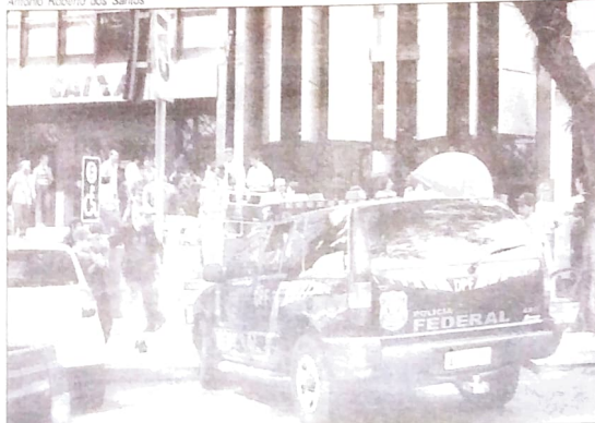
Até a Polícia Federal foi mobilizada contra a greve dos bancários

ção dos trabalhadores, garantidos pela Constituição. Na base do Pactu, a Justiça concedeu vários interditos, com multas que superavam a capacidade financeira dos sindicatos e o que acabou levando à reabertura de muitas agências bancárias. Veja nos quadros ao lado a quantidade e os valores (deferidos pela Justiça) nos interditos proibitórios na base do Pactu.