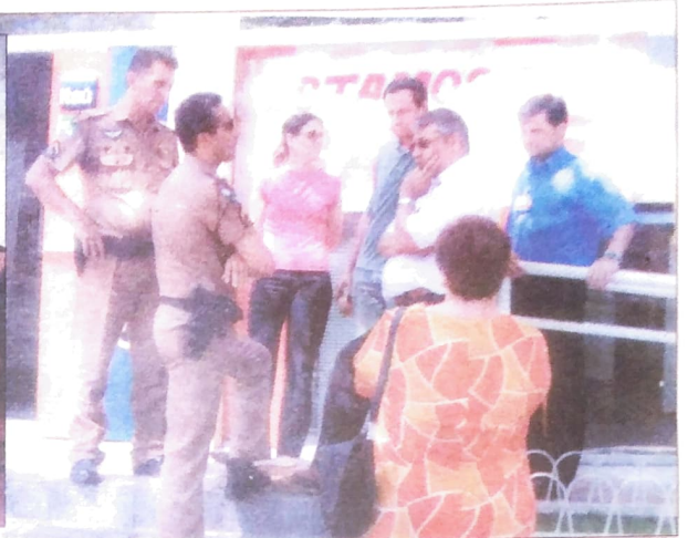
Em Umuarama, a assembléia aprovou greve, mas Bradesco e Itaú tentaram impedir, chamando a policia em Assis, Icaraíma e Umuarama