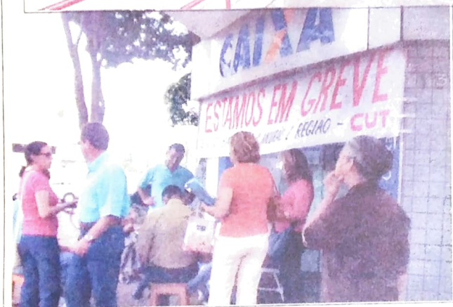
Organização e muita disposição também foi o que mostraram os bancários de Campo Murão