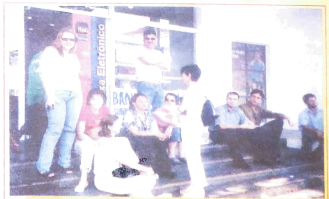
Em Paranavai também houve expressiva participação dos bancários na greve que parou o sistema financeiro