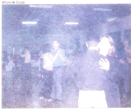
Em Umuarama, também teve boa música para dançar