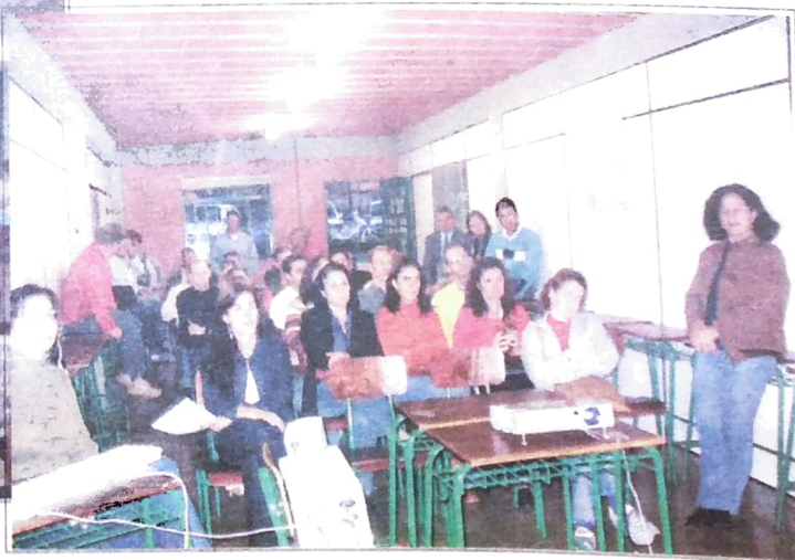
Em Toledo, os bancários marcaram presença maciça nas assembleias e na greve organizada pelo Sindicato