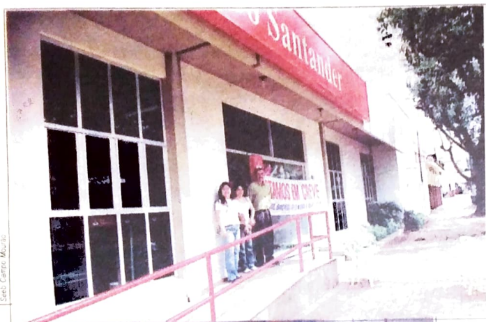
Sede, Campo Murão