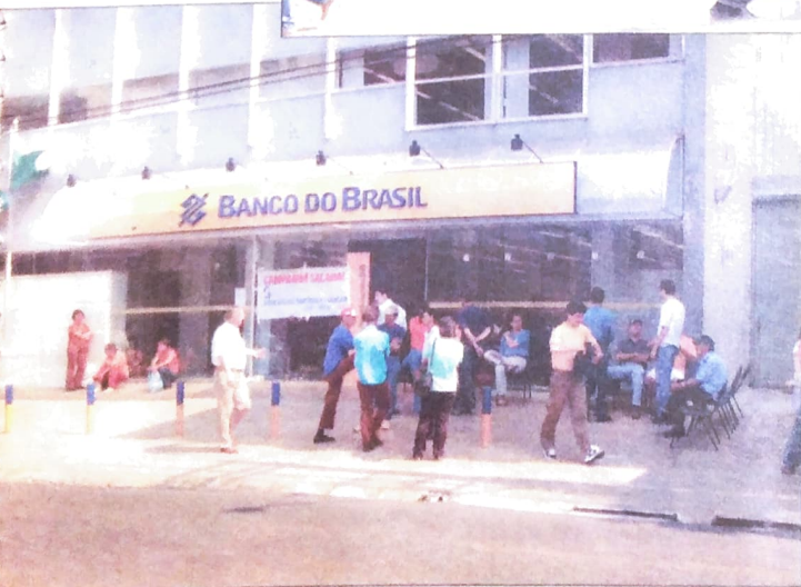
Guarapuava, a greve mobilizou a maioria absoluta dos bancários