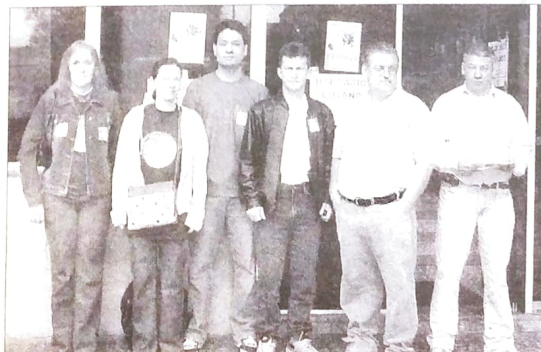
As fotos acima mostram momentos da participação do PACTU na paralisação do Centro Financeiro de São Paulo, no dia 25/08