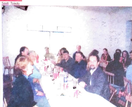
Almoço dos bancários em Marechal C. Rondon