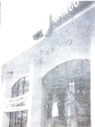
Wilson de Souza

Os Sindicatos do Pactu acreditam que o banco cumpra a decisão e que se estenda para todos os Estados, caso contrário medidas idênticas serão tomadas.